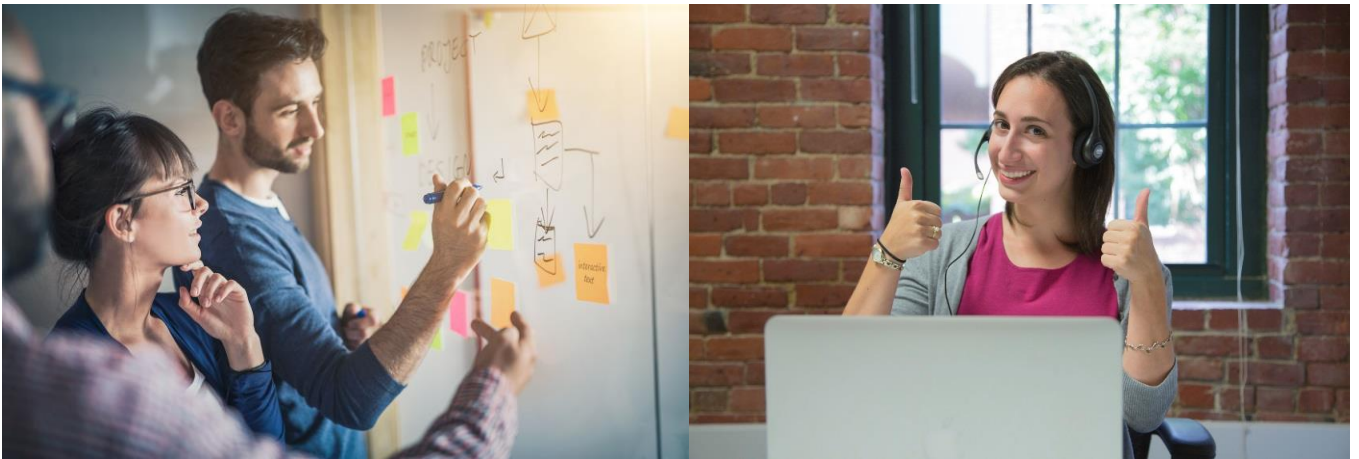
Nossa equipe tem ampla vivência profissional e acadêmica.

Desenvolvemos soluções em gestão de pessoas através de projetos específicos ou através de assessoria continuada.